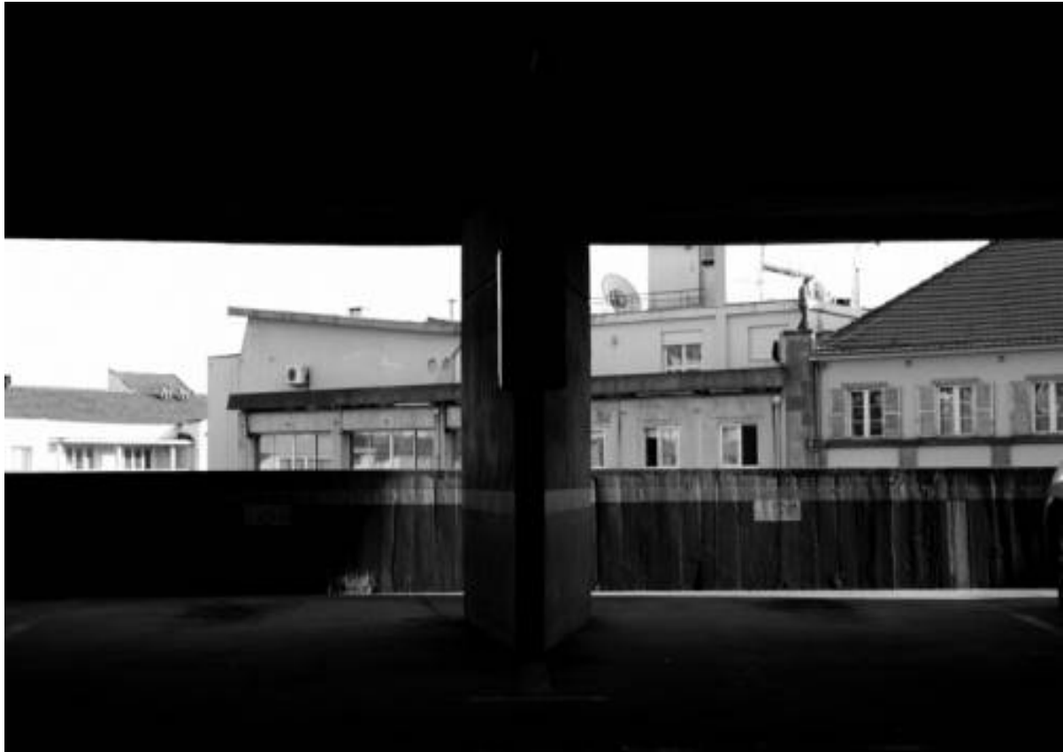
"Walk On The Wild Side"