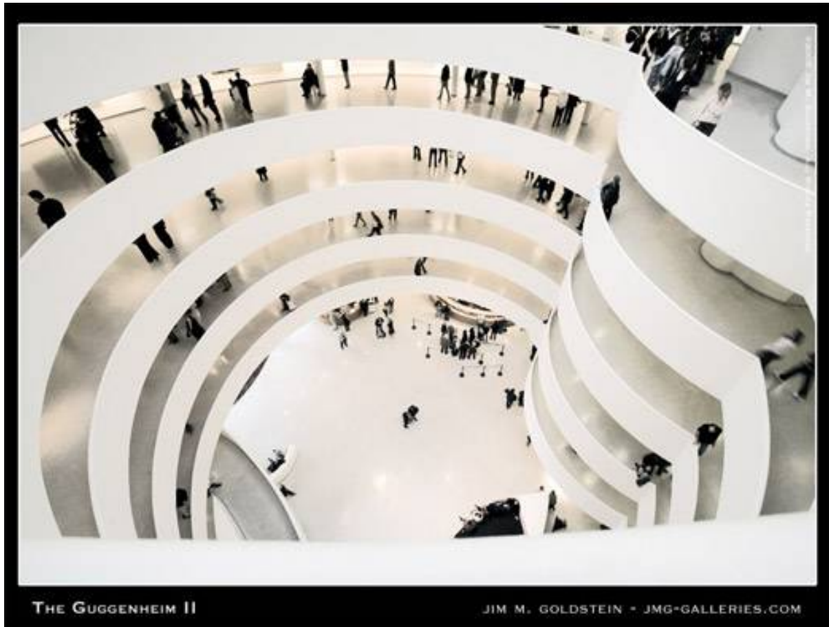
THE GUGGENHEIM II